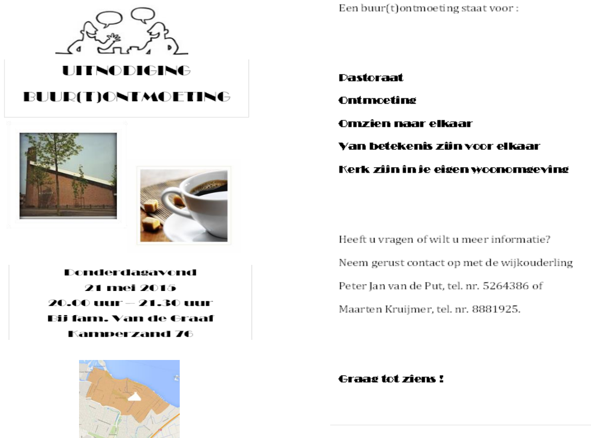
Figuur 3. Uitnodiging Buur(t)ontmoeting

Evaluerend is deze eerste ervaring van een buur(t)ontmoeting op 21 mei 2015 positief te noemen. De buur(t)ontmoeting werd positief ontvangen door de aanwezigen kerkelijke én niet-kerkelijke meeleverenden. Er is tijd genomen voor onderlinge kennismaking, voor uitleg van de bijeenkomst, er is tijd genomen voor een Bijbelse bezinning en middels zelfgemaakte 'stellingen op tafel' vond het onderling gesprek plaats. In verwachting van een tweede bijeenkomst is afscheid genomen.